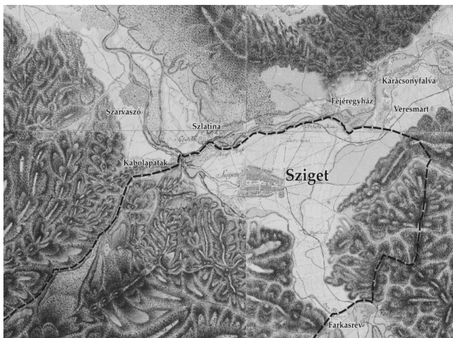
1. térkép. Sziget és környéke az I. katonai felmérésen (a város határával)

A belterület a folyóközi sík középső részén alakult ki. Első térképes ábrázolásai az 1770-es évekből származnak. 5 Ezeken egy hosszú, kelet–nyugati irányú, középtájt enyhén kiszélesedő piactúcat látunk, két oldalán egy-egy teleksorral (Tisza, illetve Iza sor/utca/szer). A főutcai teleksorok háta mögött ekkoriban már újabb utcát és teleksort találunk, de még az 1744-es urbárium is csak a Tisza és az Iza sort ismeri, így 1600 táján is